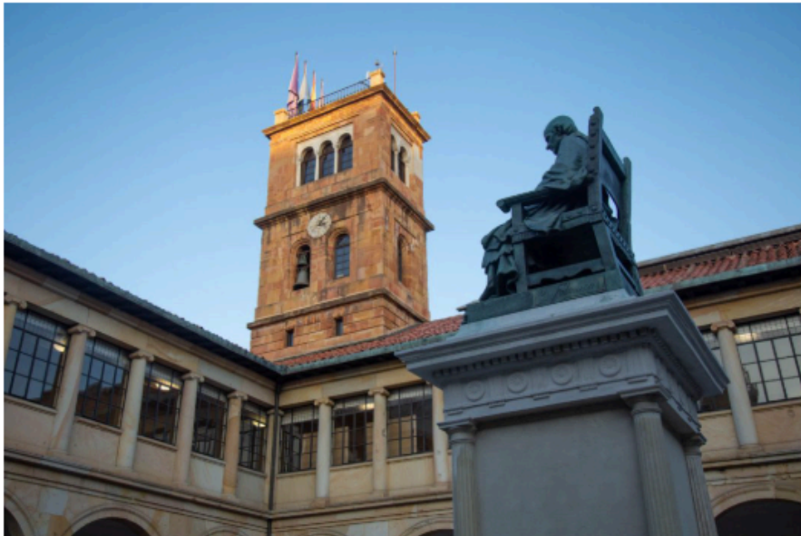
La Universidad de Oviedo

Seis de cada diez universitarios asturianos desearían quedarse en Asturias tras finalizar sus estudios, aunque tres de cada diez no creen que logren encontrar empleo en ese momento, según refleja el cuarto Barómetro sobre Expectativas del Estudiante Universitario Asturiano , que también señala que casi la mitad de ellos prefiere trabajar en el sector público.