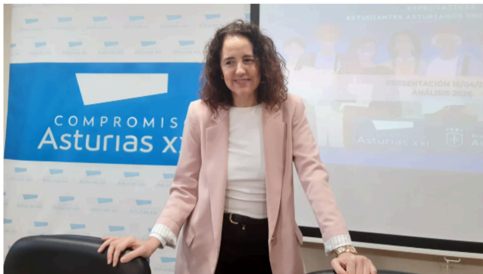
Los estudiantes universitarios priman la calidad del empleo a las condiciones salariales | ondacero.es