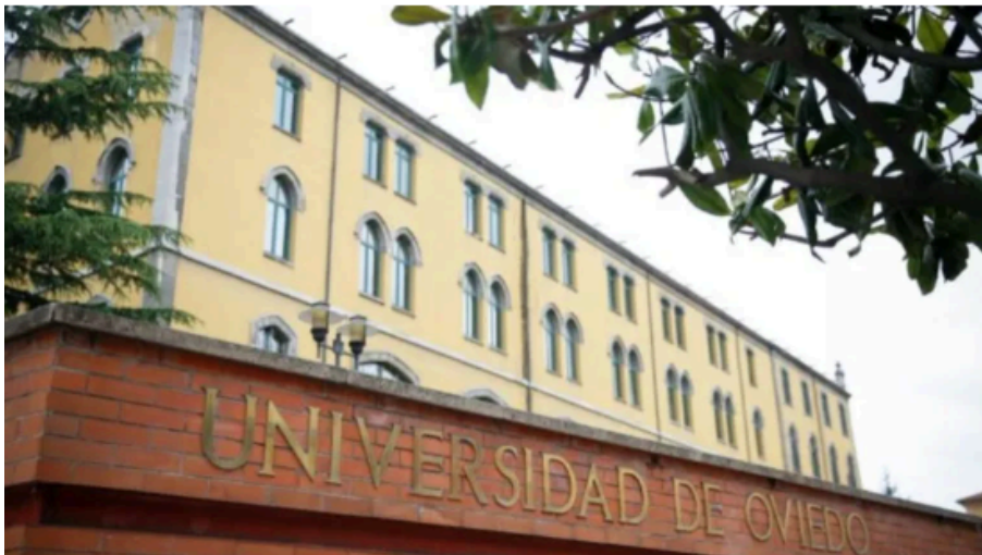
Universidad de Oviedo

Las estadísticas reflejan que tres de cada diez no cree que logre encontrar empleo en este momento