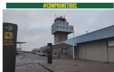
Aeropuerto de Asturias - EUROPA PRESS OVIEDO, 2 Mar. (EUROPA PRESS) -

Las conexiones aéreas de Asturias con pendientes de su justificación económic