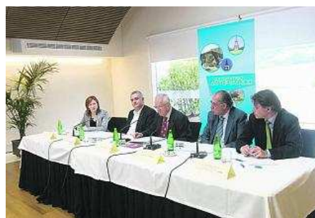
Público asistente al debate de ayer en Las Caldas. miki lópez

De la crisis también se puede hacer una lectura positiva. Aunque el contexto económico adverso ha tenido su impacto en el sector turístico asturiano, también ha favorecido cambios positivos. El Principado ha salido reforzado con la crisis como destino turístico, dado que la demanda ha cambiado: los españoles se decantan ahora por el turismo nacional y períodos de vacaciones cortas, un modelo en el que encaja la oferta asturiana. Además, al desinflarse la burbuja inmobiliaria, toda la mano de obra del sector turístico que había huido a la construcción en busca de mejores sueldos y horarios ha vuelto; de manera que los empresarios pueden elegir al personal mejor formado, lo que redundará en la profesionalización del sector.